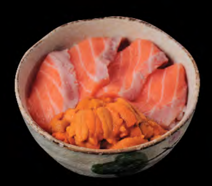
サーモンとうに丼 海鵬三文魚飯 Sea Urchin and Salmon Donburi