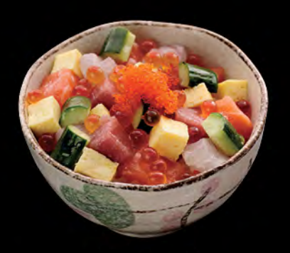
ばらちらし丼 雑錦魚生飯 Assorted Sashimi Donburi