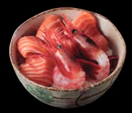
サーモンと甘えび丼 三文魚甜蝦飯 Salmon and Sweet Shrimp Donburi