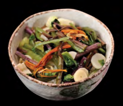
山菜丼 山野菜飯 Vegetables Donburi