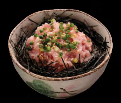
ねぎとろ丼 葱吞拿魚生飯 Minced Tuna & Spring Onion Donburi