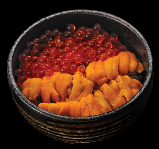
うにイクラ丼 $298 海膽三文魚籽飯 Sea Urchin & Salmon Roe Donburi

日本産うにイクラ丼 $588 日本海膽三文魚籽飯 Japanese Sea Urchin & Salmon Roe Donburi