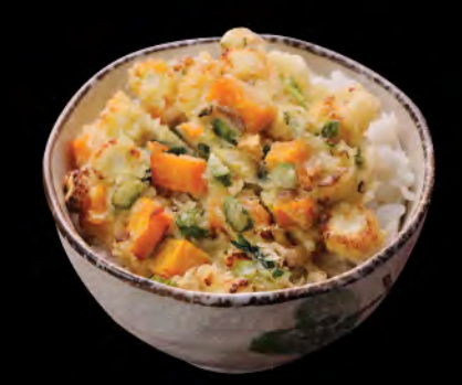
えびかき揚げ丼 天扶良蝦餅飯 Mixed Vegetable and Shrimp Cake Tempura Donburi