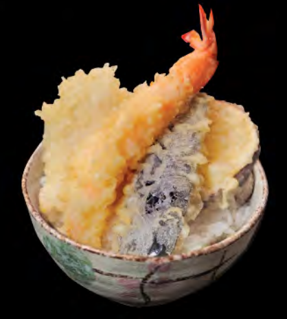
天丼 天扶良飯 Tempura Donburi