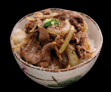
牛丼 汁燒牛肉飯 Grilled Beef Slice Donburi