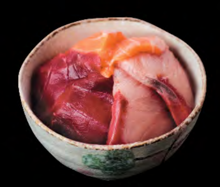
三色丼 三色魚生飯 Salmon, Tuna & Snapper Donburi