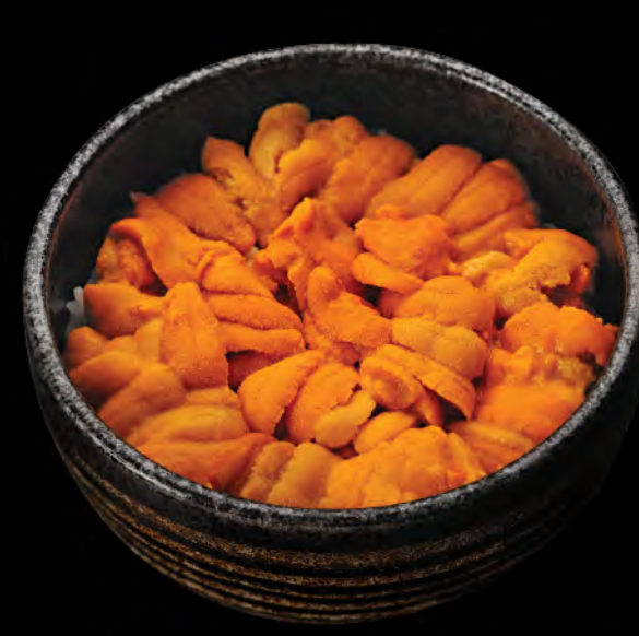
うに丼 $298 海膽飯 Sea Urchin Donburi

日本産うにイクラ丼 $588 日本海膽三文魚籽飯 Japanese Sea Urchin & Salmon Roe Donburi