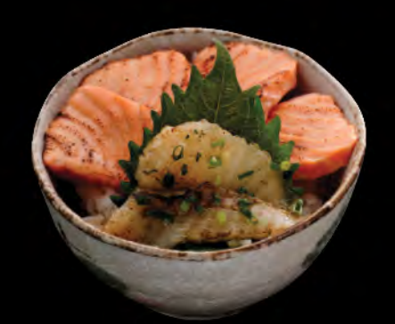
焼霜海鮮丼 霜燒魚生飯 Flamed Sashimi Donburi