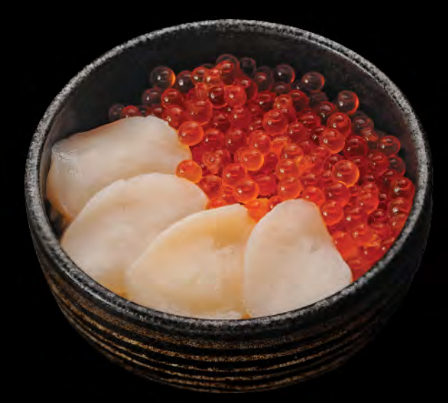
北海道ホタテイクラ丼 $298 北海道帶子日本三文魚籽飯 Scallop & Salmon Roe Donburi