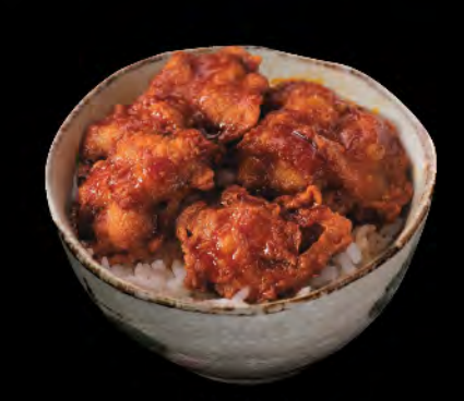
若鶏唐揚げ丼 日式炸雞飯 Deep-fried Chicken Donburi