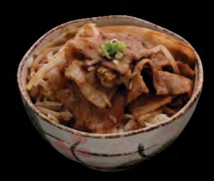
豚の生姜焼き丼 黑豚肉生薑燒飯 Japanese Pork with Ginger Sauce Donburi