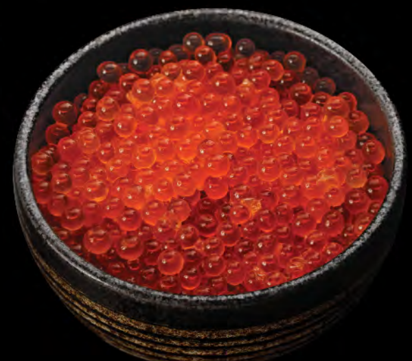
日本産イクラ丼 $298 日本三文魚籽飯 Japanese Salmon Roe Donburi