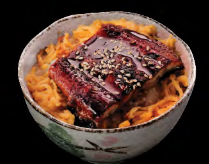
うな丼 鰻魚飯 Eel Donburi