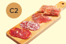
C2 Embutido Platter 伊比利亞香腸拼盤