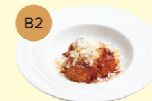
B2 Spanish Meatball (Albondigas) 西班牙蕃茄肉丸