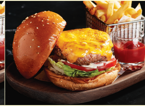
US Premium Angus Beef Burger $168 with Fries & Truffle Aioli 美國頂級安格斯牛肉漢堡 配薯條及松露蛋黃醬