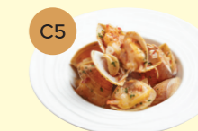
C5 Sautéed Garlic Spicy Clam 炒香蒜辣椒大蜆