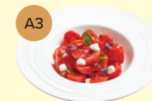
A3 Marinated Tomato & Feta Cheese 醃製蕃茄配菲達芝士