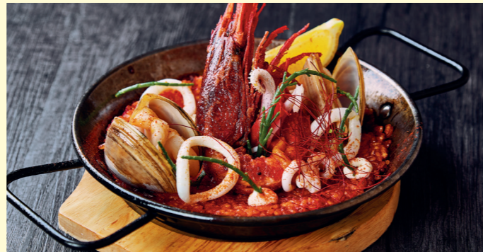
Seafood Paella (Upgrade to Red Prawn +$138) $248 西班牙海鮮飯 (升級至西班牙紅蝦 +$138)