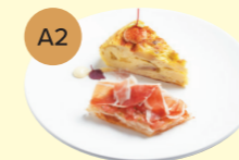
A2 Tortilla de Patatas 西班牙薯仔蛋餅