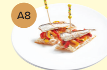
A8 Mediterranean Sardine & Escalivada Pinchos (2pcs) 地中海沙甸魚伴橄欖油烤蔬菜脆多士 (2件)