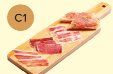
C1 Mini Jamón Platter 迷你伊比利亞火腿拼盤