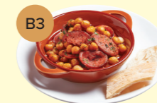
B3 Fried Chorizo, Chickpea & Apple Cider 香煎辣肉腸配鷹嘴豆及蘋果酒