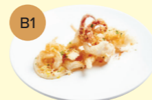
B1 Deep Fried Calamari with Garlic Aioli 炸魷魚圈配香蒜蛋黃醬