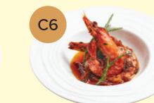
C6 Sautéed Paprika Garlic Prawn 香煎紅椒香蒜大蝦