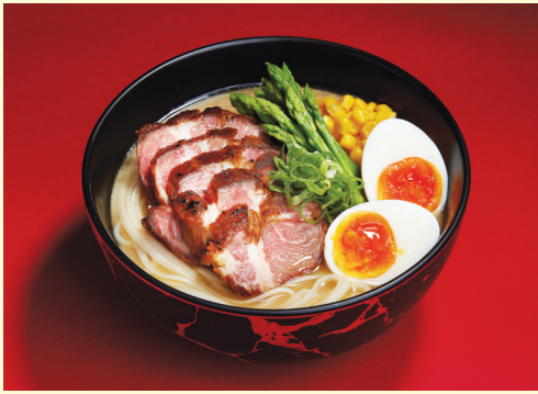
100% Acorn-fed Ibérico Ham Noodle Soup 百分百橡果餵飼純種黑毛豬湯麵