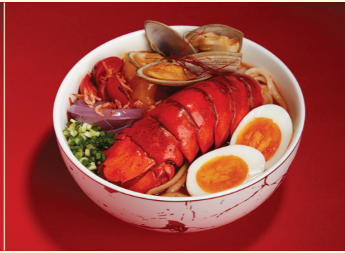
Chef's Special Lobster Noodle Soup 主廚精選龍蝦湯麵