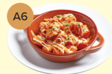
A6 Patatas Bravas, Spicy Mojo Picón & Paprika 西班牙薯仔粒配香辣蕃茄汁