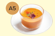
A5 Gazpacho 西班牙凍湯