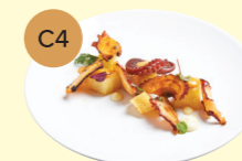
C4 Galician Style Octopus 香煎八爪魚配煙熏紅椒粉