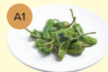
A1 Padrón Pepper & Flor de Sal 西班牙小辣椒配海鹽花