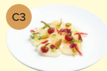
C3 Citrus Scallop Ceviche 帶子刺身薄切配檸檬油醋汁