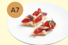
A7 White Anchovy & Piquillo Pepper Pinchos (2pcs) 白鯷魚伴西班牙紅甜椒脆多士 (2件)