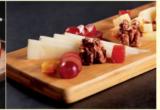
Gourmand Queso Platter $178 10g each 至尊芝士拼盤 $238 20g each