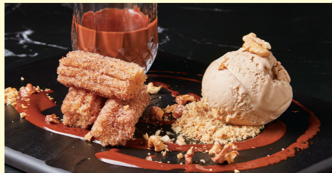
Churros, Nutella Chocolate & Ice Cream $78 西班牙炸油條配朱古力醬及雪糕