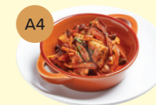
A4 Garlic Mushroom & Red Onion 香蒜蘑菇配紅洋蔥