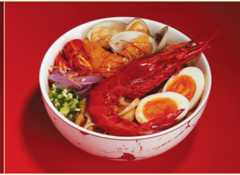
Chef's Special Red Prawn Noodle Soup 西班牙紅蝦湯麵