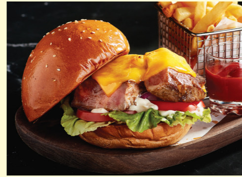
Sous-vide Ibérico Pork Burger $148 with Fries & Chipotle Aioli 慢煮伊比利亞豬肉漢堡 配薯條及辣椒蛋黃醬