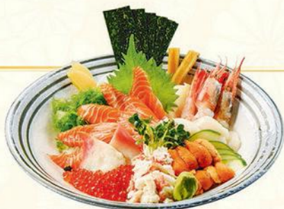
09 北海丼定食 (うに、甘えび、帆立貝、イクラ、カニ、鮭) 北海魚生飯定食 (海膽、甜蝦、帶子、三文魚籽、蟹肉、三文魚) HOKKA Sashimi on Sushi Rice Bowl (Sea Urchin, Sweet Shrimp, Scallop, Salmon Roe, Crab Meat & Salmon)