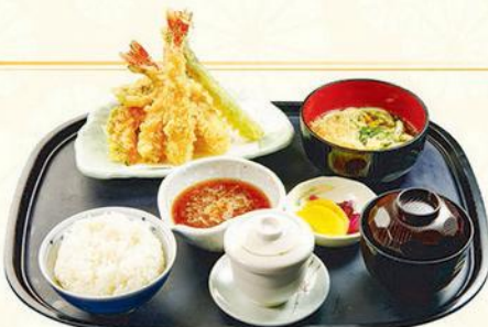
25 天婦羅定食 天婦羅定食 Assorted Tempura Set HK$250