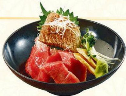
10 本鮪五重の丼 吞拿魚五重飯定食 Five Kinds Tuna Sashimi on Sushi Rice Bowl