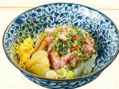
11 葱とろ丼定食 蔥免治吞拿魚腩飯定食 Spring Onion & Minced Tuna on Sushi Rice Bowl