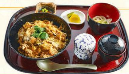
28 親子丼定食 雞肉蛋飯定食 Chicken Meat with Egg on Rice Bowl Set HK$230