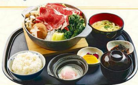
22 すき鍋定食 牛肉鍋定食 Beef Sukiyaki Set HK$280